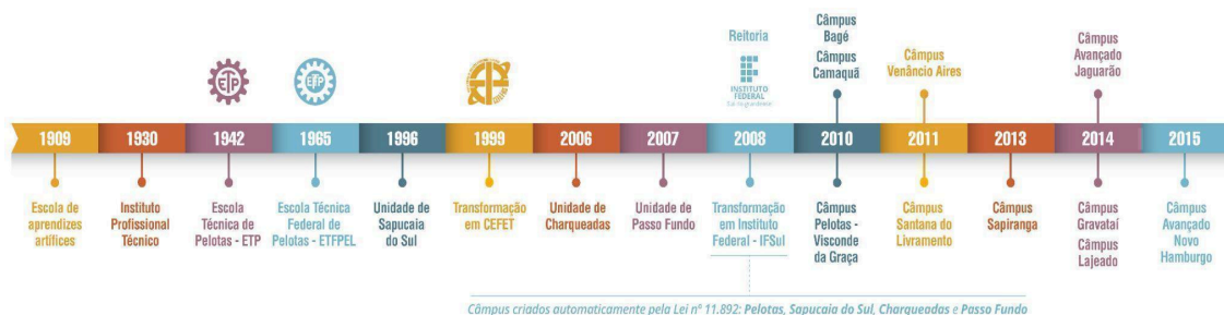
Figura 3 – Linha do tempo de evolução da Instituição