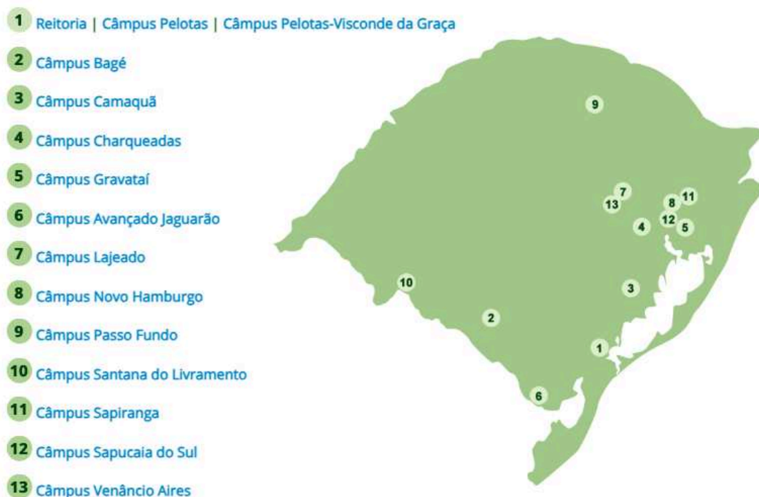
Figura 1 - Distribuição das unidades do IFSul pelo estado