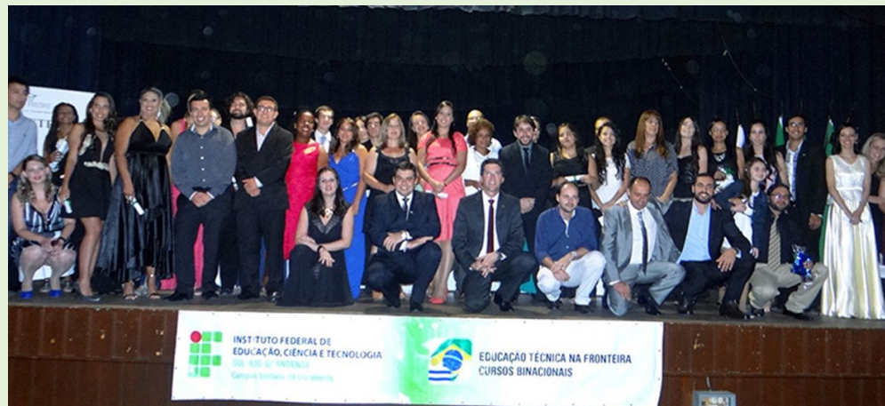
Formatura IFSul - UTU Teatro Municipal de Rivera