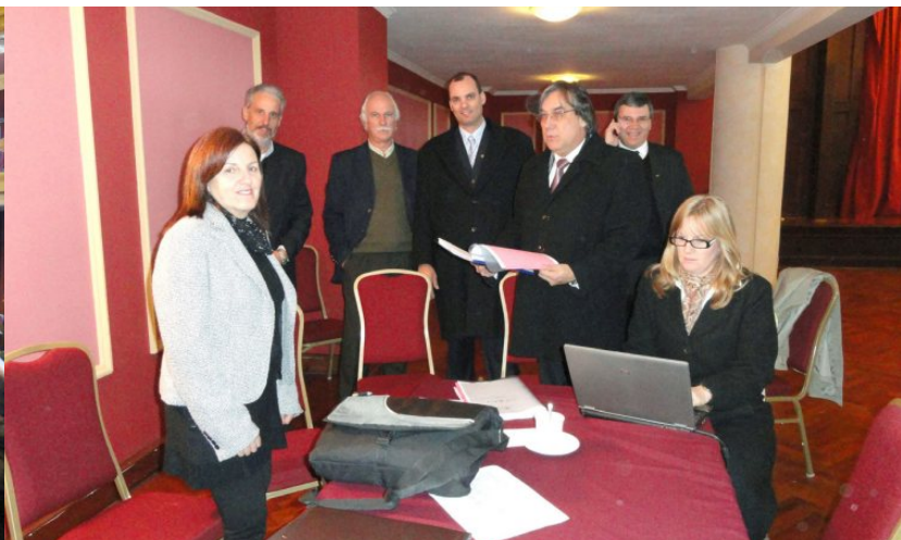
Participação do Comitê Gestor Binacional na VII Reunião Alto Nível. Montevideu / 2011