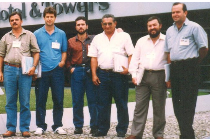
CTI/FURG, ETFPEL e ETC/UFRGS no Seminário Internacional de Educação Tecnológica, 1991, RJ

En los comienzos de 1990, fueron intensas las negociaciones en el ámbito del Mercosur. En este contexto, el Gobierno Federal promovió el Seminario Internacional de Educación Tecnológica, coordinado por la entonces Secretaría Nacional de Educación Tecnológica 2 del Ministerio de Educación, en septiembre de 1991, en Río de Janeiro.