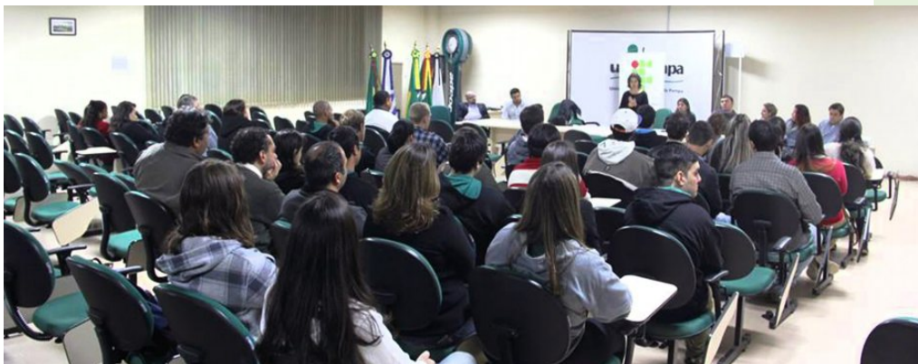
Câmpus recebe mais uma turma binacional do curso técnico em edificações Agosto/2015