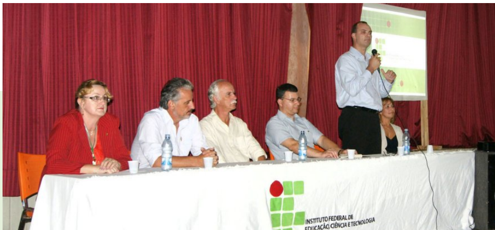
Abertura do ano letivo no câmpus avançado Santana do Livramento

El inicio de las clases en ambos países, en marzo de 2011, fue un hito en la historia de la educación profesional, una vez que el IFSul y la UTU realizaron un proyecto piloto referencia para otras iniciativas similares en regiones fronterizas.