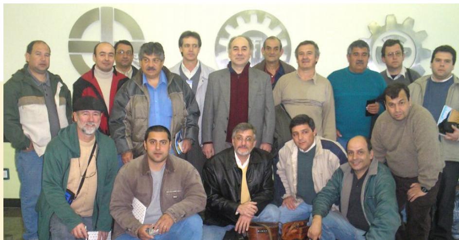
Professores do CETP-UTU - curso de capacitação no câmpus Pelotas: Projeto Indústria Meio Ambiente e Energias

y formación ofrecida por docentes del IFSul. En los cursos de capacitación participaron 15 profesores del Instituto, los cuales dictaron talleres a más de 80 docentes, gestores de la UTU y gestores públicos de las intendenencias y gobiernos departamentales en las ciudades de la región de la frontera Brasil/Uruguay: Artigas/Quaraí, Rivera/Santana do Livramento, Chuí/Chuy, Rio Branco/Jaguarão.