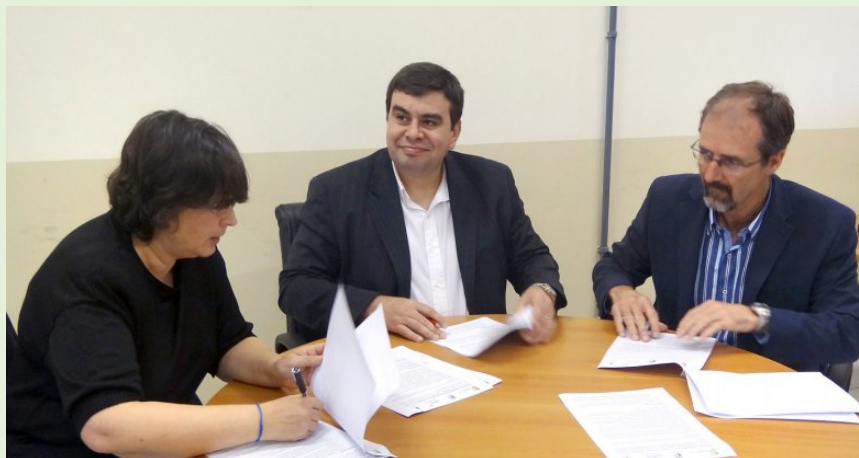
Assinatura do acordo entre o IFSul, CETP-UTU e UTEC Outubro de 2015