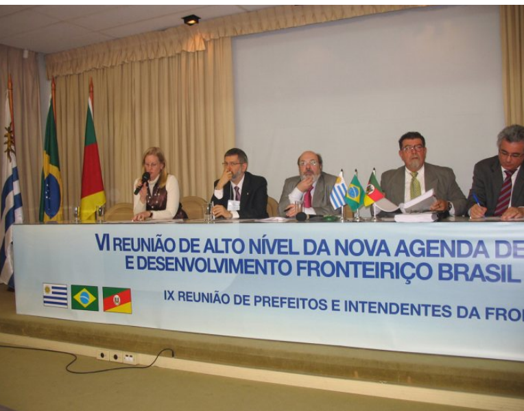
Leitura de ata do GT Educação VI Reunião de alto Nível Porto Alegre/2009