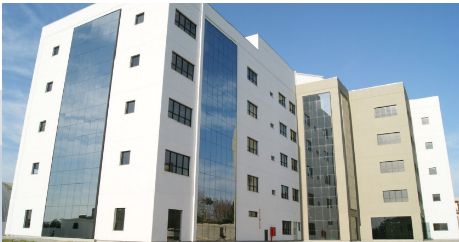
Reitoria do Instituto Federal Sul-rio-grandense - IFSul

Los Cefet-RS tenían su base en la entonces Escuela Técnica de Pelotas (ETP), inaugurada en 1943. Con la creación de la red federal, el IFSul se convierte en una agencia federal que posee autonomía administrativa, patrimonial, financiera, disciplinaria y didáctico-pedagógica.