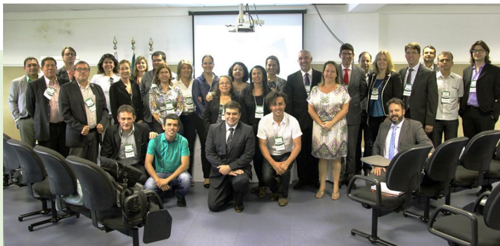
Encontro de Institutos Federais na Fronteira Agosto de 2015

El Consejo Nacional de las Instituciones de la Red Federal de Educación Profesional, Ciencia y Tecnología (Conif) acogió, en Brasília, el II Encuentro de Institutos en la Frontera, en el Instituto Federal de Brasília (IFB), con la coordinación del rector de