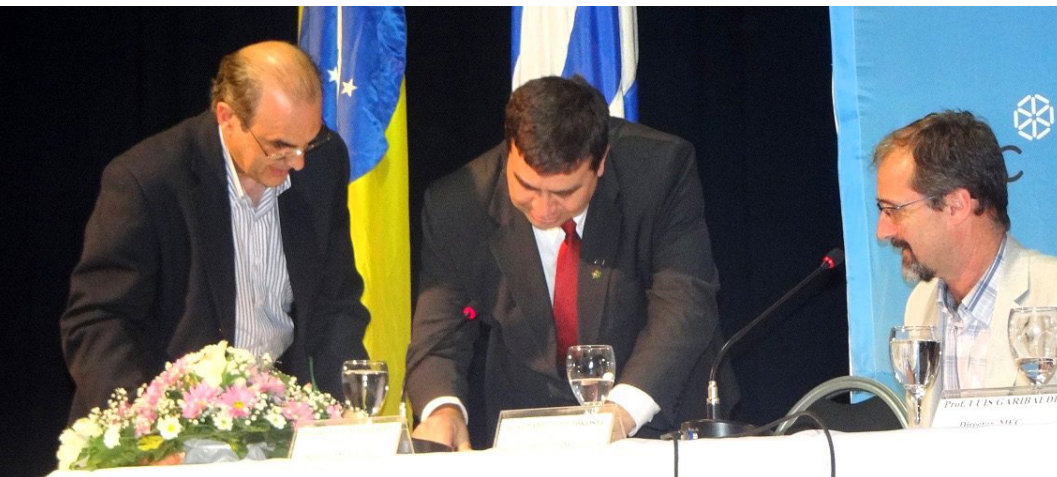
Assinatura do Acordo UTEC - IFSul Novembro de 2014

La oferta de cursos binacionales en el IFSul tuvo nuevos desarrollos a partir de la reunión celebrada en el campus de Santana do Livramento en abril de 2015. Representantes del Instituto, de la Universidad Tecnológica del Uruguay (UTEC) y de la UTU discutieron la aplicación pionera de cursos superiores binacionales en las áreas de mecatrónica e informática los cuales serán ofrecidos en colaboración entre las tres instituciones.