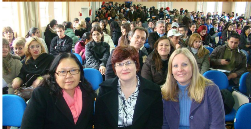
Audiência Pública em Santana do Livramento, 2009