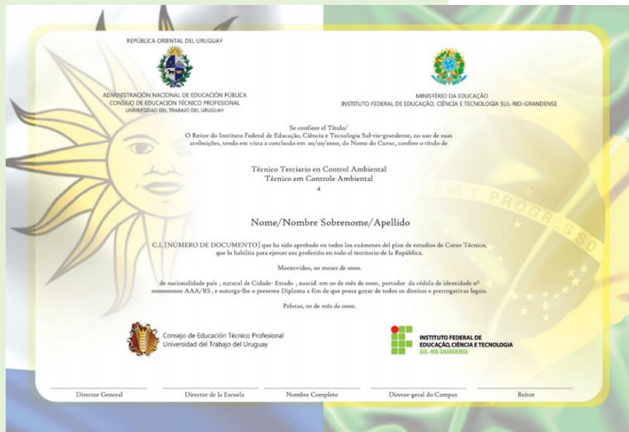
Certificado Binacional - Modelo

Inicialmente foram oferecidos, no câmpus Santana do Livramento, os cursos de Informática para Internet e Controle Ambiental. Na sequência foram implantados os cursos de Eletroeletrônica, Logística, Sistemas de Energia Renovável e Gastronomia.