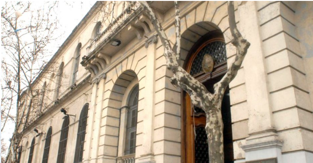
Consejo de Educación Técnico Profesional - Universidad del Trabajo del Uruguay CETP-UTU

La Ley Nº 15.739 de 28 de marzo de 1985 estableció la creación de la Administración Nacional de Educación Pública (ANEP), lo cual fue ratificado por la “Ley General de Educación” 18.437 de diciembre de 2008. La ANEP es un ente autónomo en conformidad con los arts. 202 y subsiguientes de la Constitución de la República. Tiene entre sus cometidos