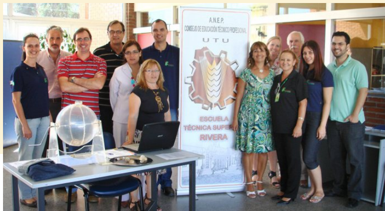
Sorteio de vagas para os estudantes uruguaios em fevereiro de 2011. Forma de seleção da CETP/UTU.