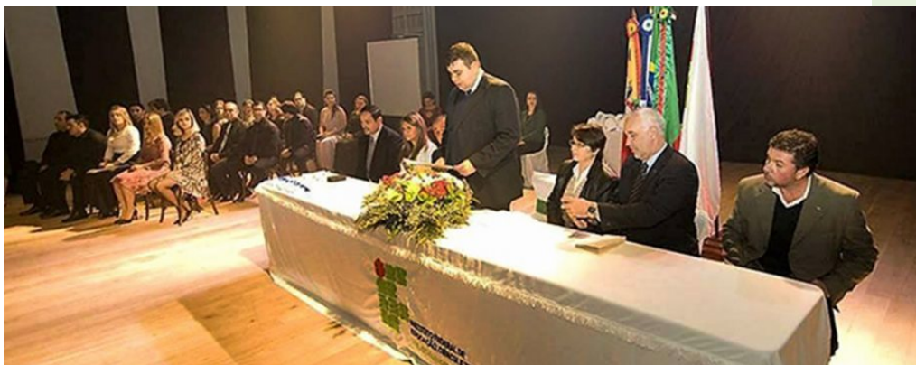
Solenidade de formatura das primeiras turmas binacionais