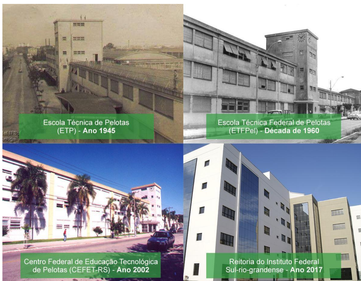
Figura 4 – Prédios da Instituição ao longo do tempo

A partir de 1953, foi oferecido o segundo ciclo da educação profissional, quando foi criado o primeiro curso técnico Construção de Máquinas e Motores. Em 1959, a ETP foi caracterizada como autarquia Federal e, em 1965, passou a ser denominada Escola Técnica Federal de Pelotas, adotando a sigla ETFPEL.