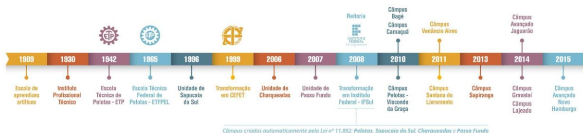
Figura 3 – Linha do tempo de evolução da Instituição

As aulas tiveram início em 1930, quando o município assumiu a Escola de Artes e Ofícios e instituiu a Escola Technico Profissional que, posteriormente, passou a denominar-se Instituto Profissional Técnico e cujos cursos compreendiam grupos de ofícios divididos em seções: Madeira, Metal, Artes Construtivas e Decorativas, Trabalho de Couro e Eletro-Chímica.