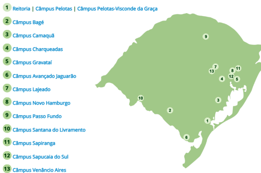
Figura 1 - Distribuição das unidades do IFSul pelo estado

A administração do IFSul tem como órgãos superiores o Colégio de Dirigentes (CODIR) e o Conselho Superior (CONSUP), cuja estruturação, competências e normas de funcionamento estão organizadas em seu Estatuto. A reitoria e os 14 (quatorze) câmpus do IFSul estão distribuídos pelo estado do Rio Grande do Sul, conforme Figura 1: