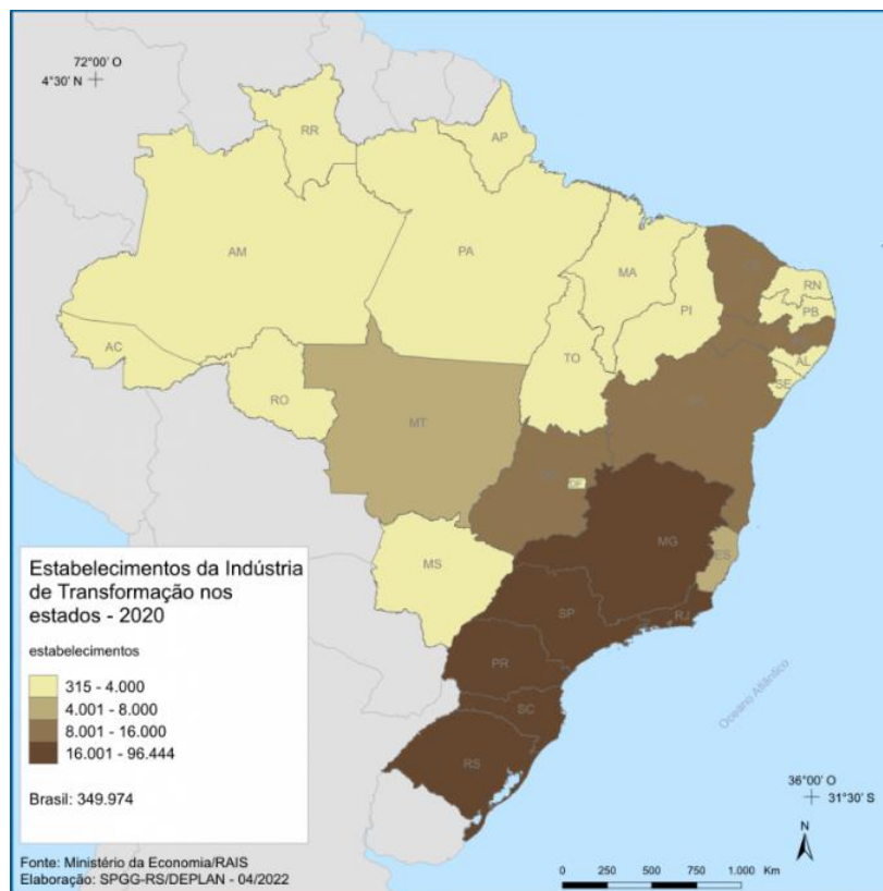
Figura 4 - Estabelecimentos de Indústrias de transformação nos estados