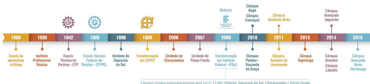
Figura 2 – Linha do tempo de evolução da Instituição

As aulas tiveram início em 1930, quando o município assumiu a Escola de Artes e Ofícios e instituiu a Escola Technico Profissional que, posteriormente, passou a denominar-se Instituto Profissional Técnico e cujos cursos compreendiam grupos de ofícios divididos em seções: Madeira, Metal, Artes Construtivas e Decorativas, Trabalho de Couro e Eletro-Chimica.