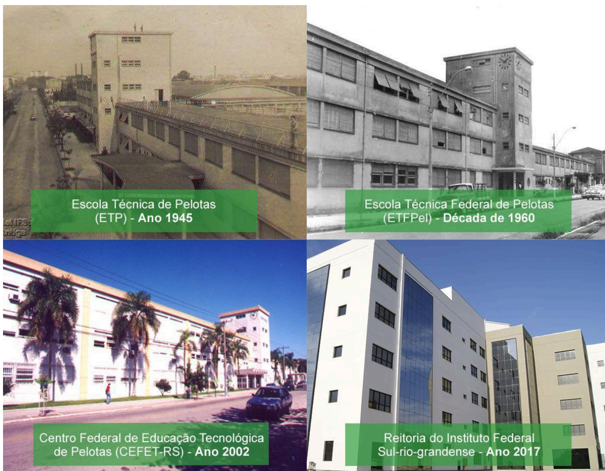
Figura 3 – Prédios da Instituição ao longo do tempo

O Instituto Profissional Técnico funcionou por uma década, sendo extinto em 25 de maio de 1940, e seu prédio demolido para a construção da Escola Técnica de Pelotas. Em 1942, por meio do Decreto-lei nº 4.127, de 25 de fevereiro, subscrito pelo Presidente Getúlio Vargas e pelo Ministro da Educação Gustavo Capanema, foi criada a Escola Técnica de Pelotas (ETP), a primeira e única Instituição do gênero no estado do Rio Grande do Sul. Inaugurada em 11 de outubro de 1943, com a presença do Presidente Getúlio Vargas, começou suas atividades letivas em 1945, com cursos de curta duração (ciclos).