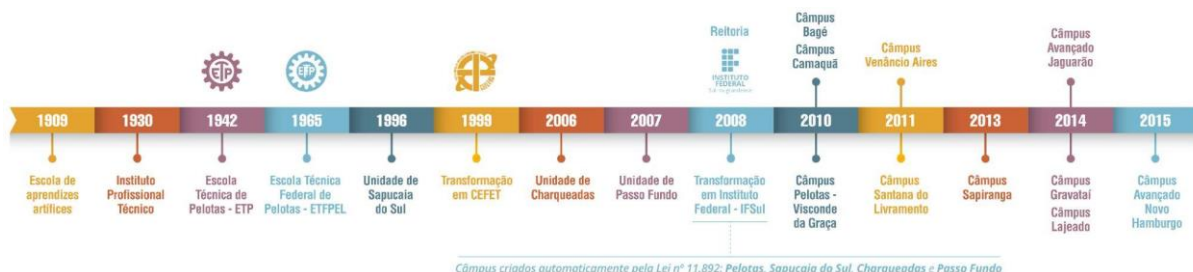
Figura 2 – Linha do tempo de evolução da Instituição

As aulas tiveram início em 1930, quando o município assumiu a Escola de Artes e Ofícios e instituiu a Escola Técnico Profissional que, posteriormente, passou a denominar-se Instituto Profissional Técnico e cujos cursos compreendiam grupos de ofícios divididos em seções: Madeira, Metal, Artes Construtivas e Decorativas, Trabalho de Couro e Eletro-Chimica.