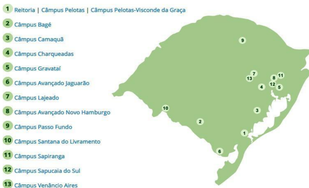
Figura 1 - Distribuição das unidades do IFSul pelo estado

A administração do IFSul tem como órgãos superiores o CODIR e o CONSUP, cuja estruturação, competências e normas de funcionamento estão organizadas em seu Estatuto. A reitoria e os 14 câmpus do IFSul estão distribuídos pelo estado do Rio Grande do Sul conforme apresentado na Figura 1.