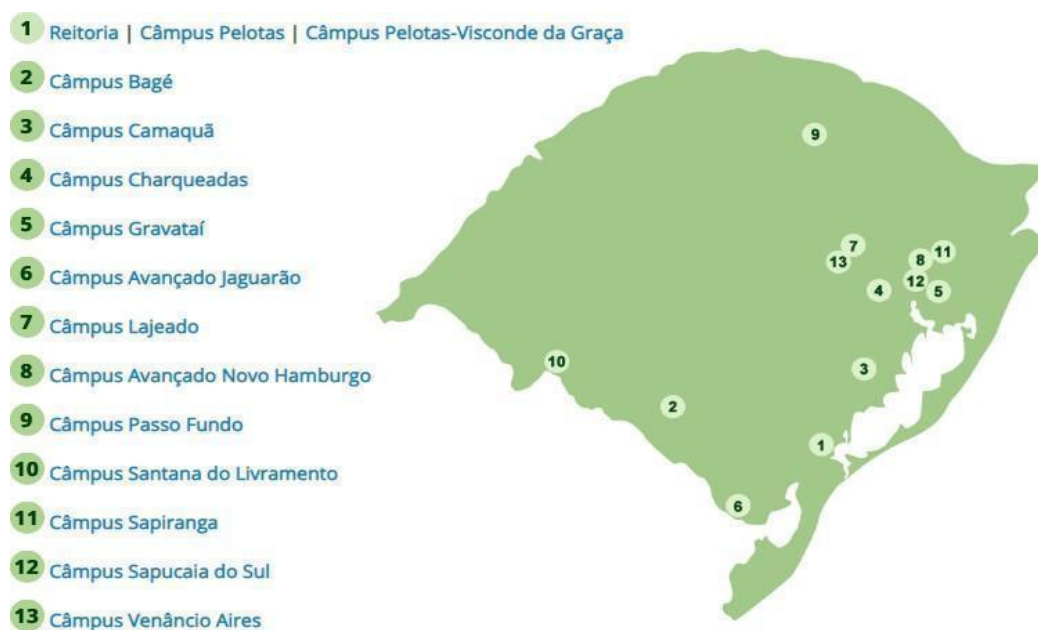
Figura 1 - Distribuição das unidades do IFSul pelo estado

Segundo a Plataforma Nilo Peçanha (PNP), que reúne dados da Rede Federal de Educação Profissional, Científica e Tecnológica (Rede Federal) para fins de cálculos de indicadores, o IFSul atende um total de 24.369 discentes (ano base 2018), matriculados em cursos nas modalidades presencial e a distância. Também exerce o papel de instituição acreditadora e certificadora de competências profissionais.