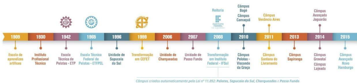
Figura 2 – Linha do tempo de evolução da Instituição

As aulas tiveram início em 1930, quando o município assumiu a Escola de Artes e Ofícios e instituiu a Escola Técnico Profissional que, posteriormente, passou a denominar-se Instituto Profissional Técnico e cujos cursos compreendiam grupos de ofícios divididos em seções: Madeira, Metal, Artes Construtivas e Decorativas, Trabalho de Couro e Eletro-Chímica.