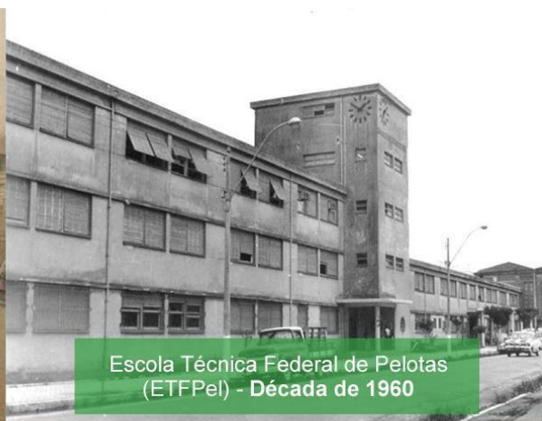
Escola Técnica Federal de Pelotas (ETFPel) - Década de 1960