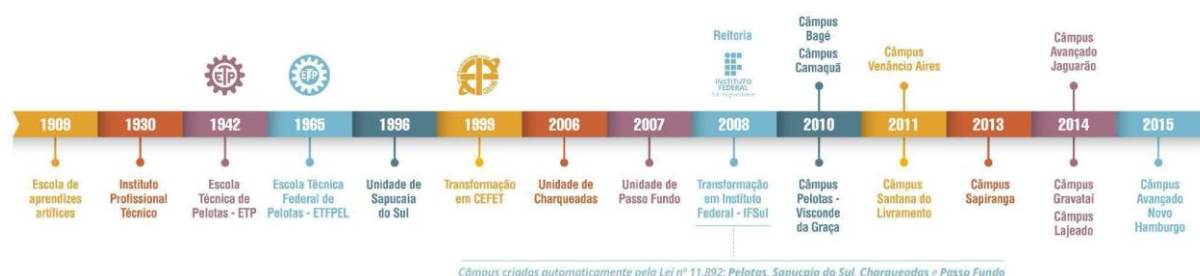
Figura 2 – Linha do tempo de evolução da Instituição

As aulas tiveram início em 1930, quando o município assumiu a Escola de Artes e Ofícios e instituiu a Escola Technico Profissional que, posteriormente, passou a denominar-se Instituto Profissional Técnico e cujos cursos compreendiam grupos de ofícios divididos em seções: Madeira, Metal, Artes Construtivas e Decorativas, Trabalho de Couro e Eletro-Chimica.