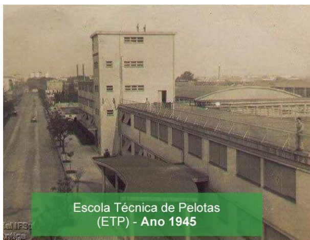
Escola Técnica de Pelotas (ETP) - Ano 1945