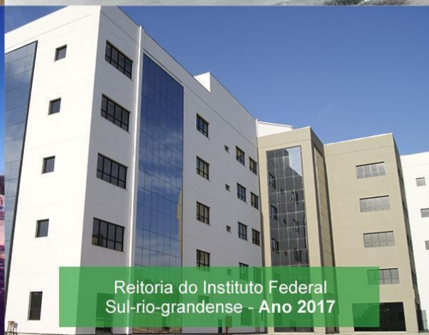
Reitoria do Instituto Federal Sul-rio-grandense - Ano 2017

O Instituto Profissional Técnico funcionou por uma década, sendo extinto em 25 de maio de 1940, e seu prédio demolido para a construção da Escola Técnica de Pelotas. Em 1942, por meio do Decreto-lei nº 4.127, de 25 de fevereiro, subscrito pelo Presidente Getúlio Vargas e pelo Ministro da Educação Gustavo Capanema, foi criada a Escola Técnica de Pelotas (ETP), a primeira e única Instituição do gênero no estado do Rio Grande do Sul. Inaugurada em 11 de outubro de 1943, com a presença do Presidente Getúlio Vargas, começou suas atividades letivas em 1945, com cursos de curta duração (ciclos). Neste primeiro ciclo do ensino industrial, os cursos estabelecidos foram: de Forja, Serralheria, Fundição, Mecânica de Automóveis, Máquinas e Instalações Elétricas, Aparelhos Elétricos, Telecomunicações, Carpintaria, Artes do Couro, Marcenaria, Alfaiataria, Tipografia e Encadernação.