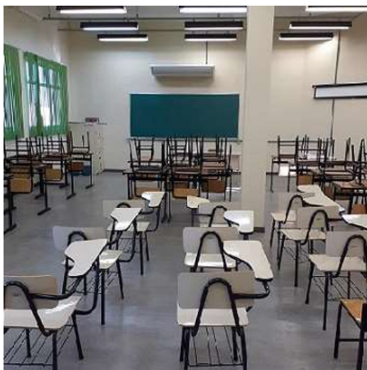
Figura 9 – Miniauditório