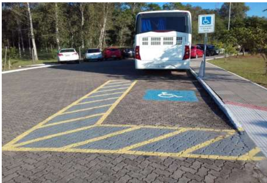
Figura 2 – Rampa para acesso a cadeirantes.