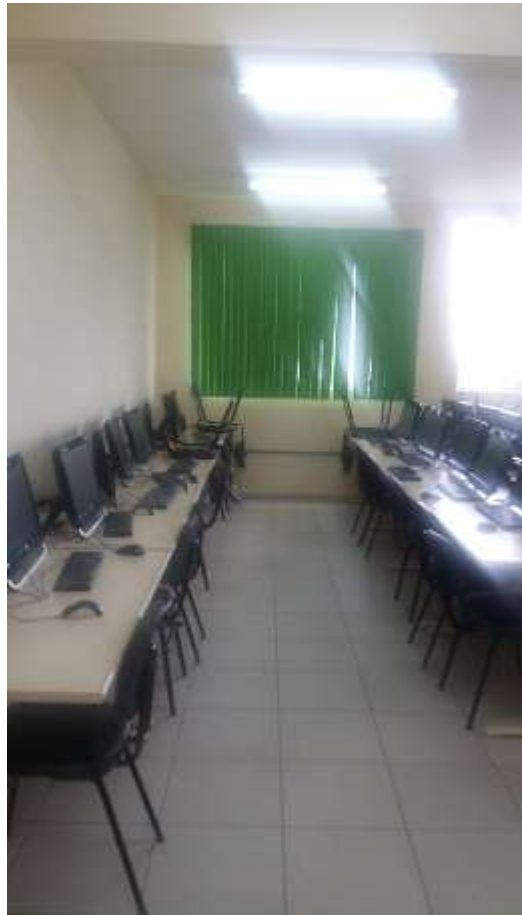
Figura 13 – Laboratório de Informática 605