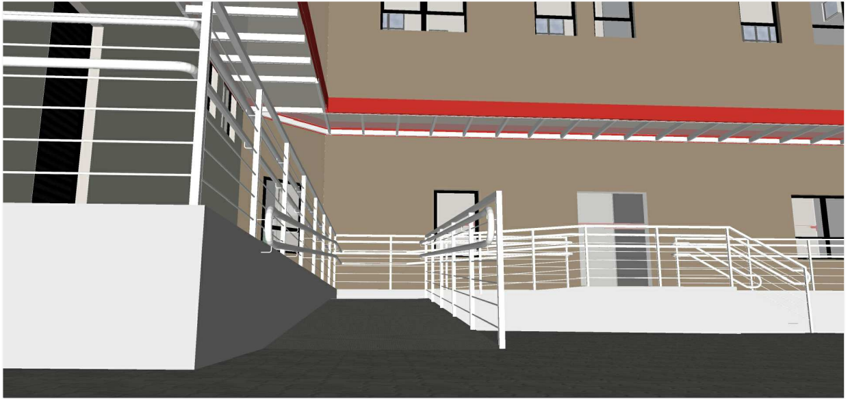
PERSPECTIVA 13 - CONJUNTOS 3 E 5