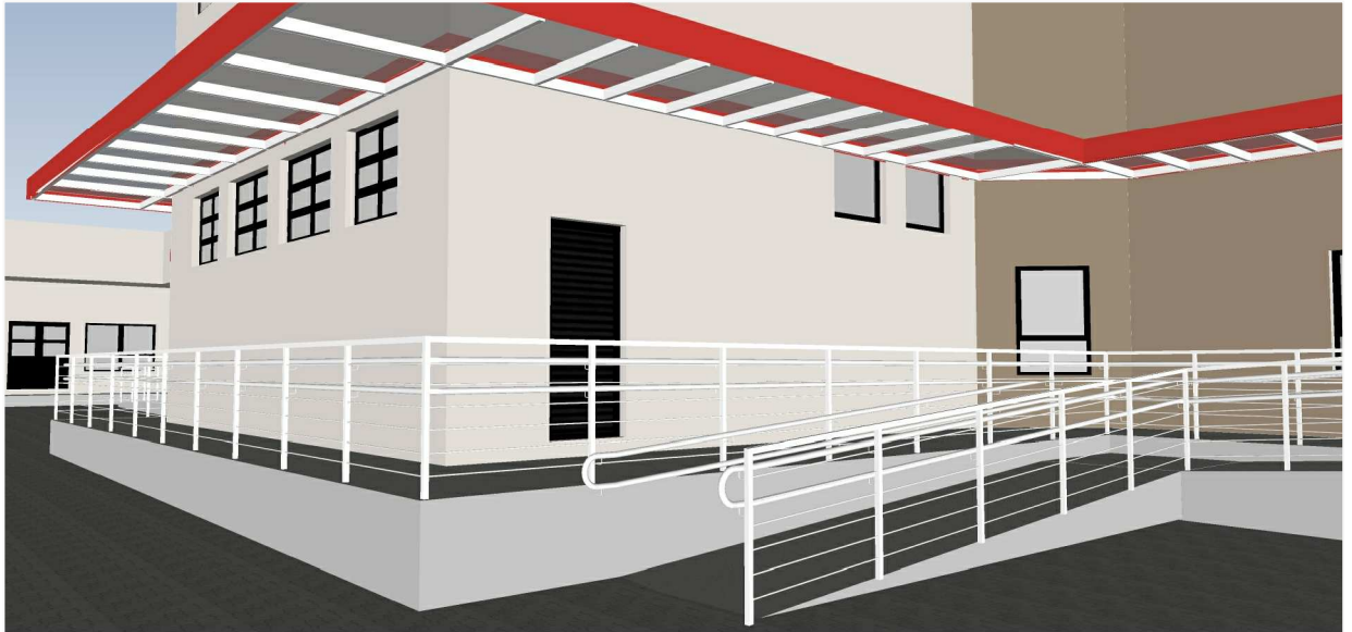
PERSPECTIVA 5 - CONJUNTOS 3 E 5